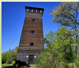
Den Aussichtsturm erreichen Sie