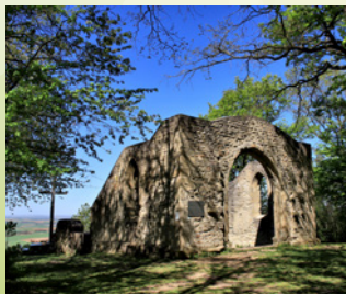
Die Mauerreste der Kapelle auf einer vorgeschobenen Zunge des

Kapellenbergs östlich von Bullenheim stammen aus der Zeit um 1500. Der Bau ersetzte eine ältere Kapelle.